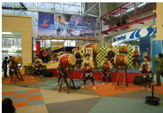
ガーラカーニバル（3月）