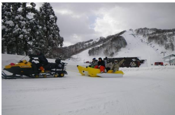
バナナボート（2月～3月）