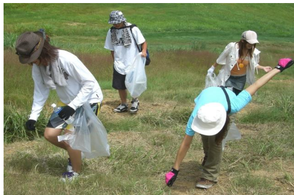
パーククリーン活動（8月）