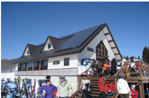
太陽光発電の設置（北エリアレストラン）