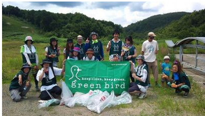
パーククリーン活動（8月）