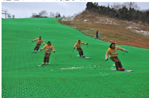
スノーマットによるプレオープン (11月)