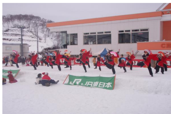
GALA スノーカーニバル (3月)