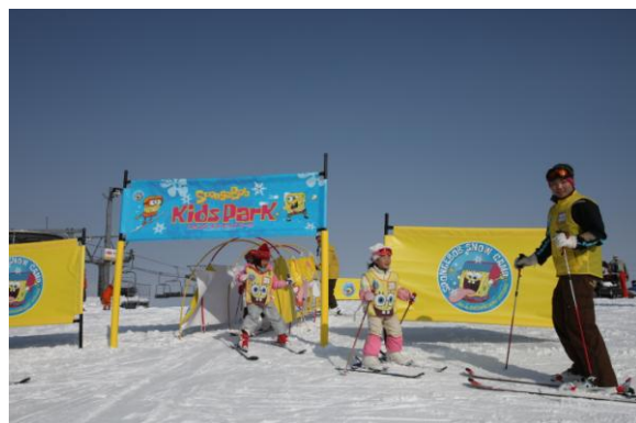
キッズパークの展開