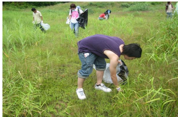
パーククリーン活動 (8月)