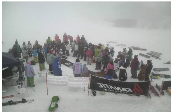
アースディ・スノーフェスタ チャリティオークション (4月)