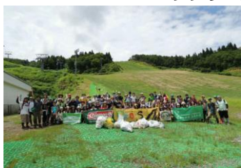
パーククリーン活動（7月）