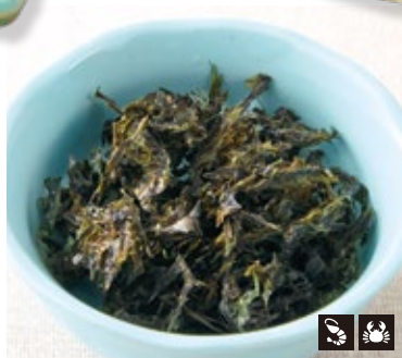
79 岩のり 182円 (¥200円)