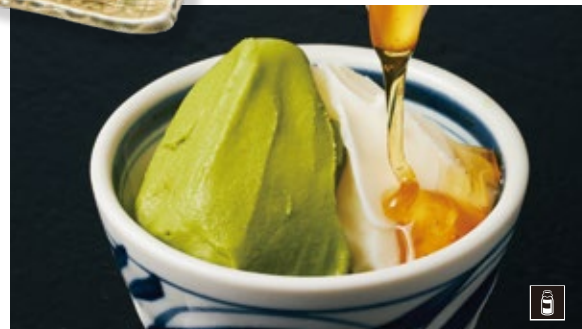
80 濃厚ミルクと京都宇治抹茶ジェラート (新潟産はちみつ添え) 727円 (¥800円)