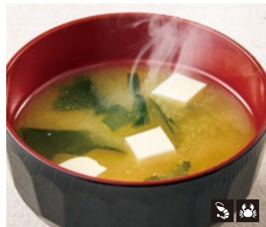
76 味噌汁 182円 (¥200円)