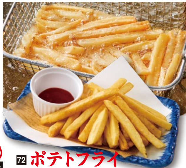
72 ポテトフライ 636円 (¥700円)