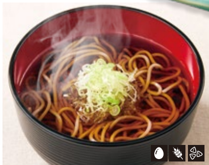
77 ミニ温そば 727円 (¥800円)