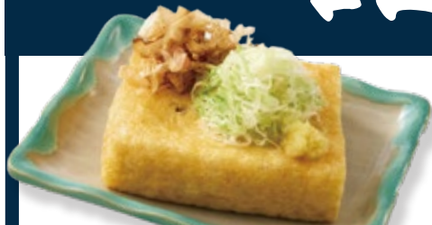
73 栃尾揚げハーフ 455円 (¥500円)