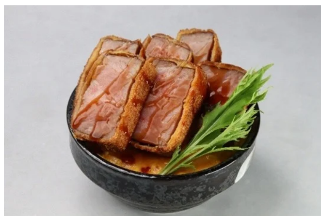
マウンテンかつ丼（チアーズ：PAL PLA）