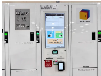
マルチエキュープ

昨シーズンより導入した多機能ロッカーマルチエキュープは大変ご好評いただいております、今シーズンはさらに間口の広い従来比約1.5倍のサイズでスーツケースなども収納可能なロッカーを24口追加導入いたしました。ぜひご利用ください。