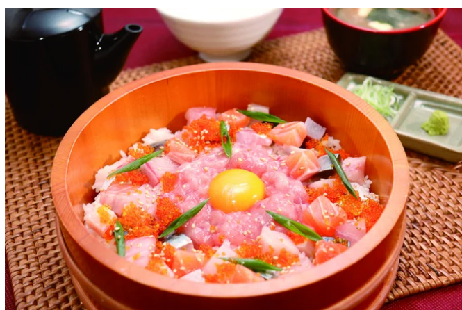
海鮮ひつまぶし（チアーズ：新潟食道）