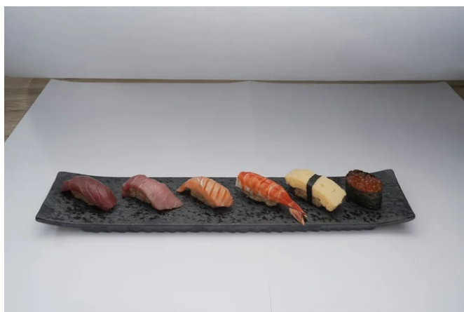
六花おすすめ握り6貫

食の多様性に応える、新スタイルダイニング「六花RIKKA」では、VEGANメニューやお寿司を中心に、幅広い食のニーズに対応した多彩なメニューをご提供します。