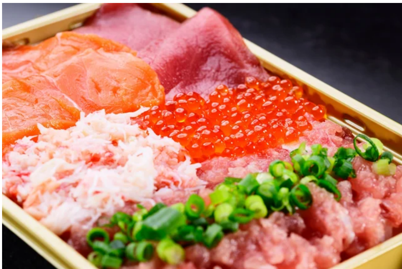
鮮極の5種盛り海鮮丼