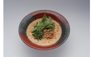
六花：ヴィーガン担々麺