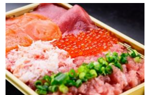
鮮極：kiwami 鮮極 5 種盛り重